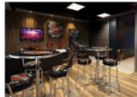
FIGURA 02: Sede da Harley Davidson com forro Sonex na Cidade de São Paulo