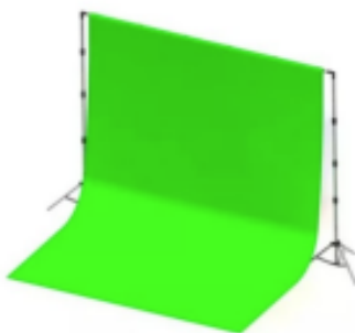
FIGURA 01: Imagem ilustrativa de suporte e rolo de chroma key