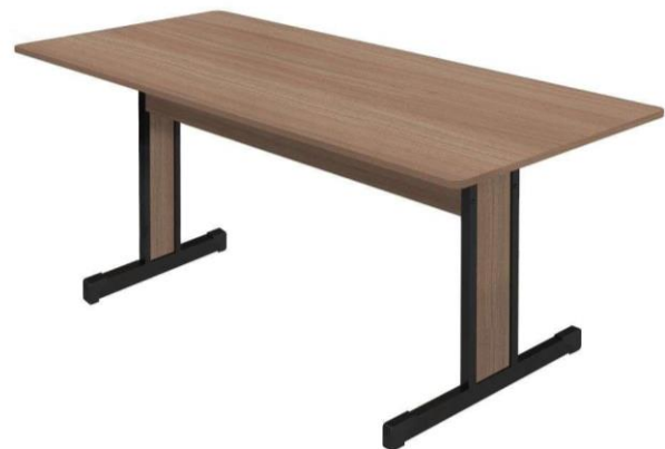
FIGURA 02: Mesa de reunião