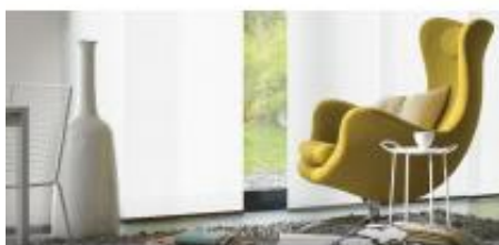
FIGURA 01: Imagem ilustrativa