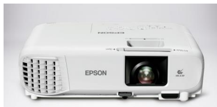
FIGURA 01: Imagem ilustrativa