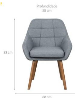
FIGURA 01: Imagem ilustrativa da poltrona