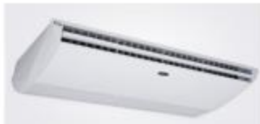
FIGURA 01: Aparelho ar-condicionado Carrier (Imagem ilustrativa)