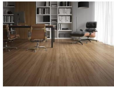
FIGURA 02: Imagem ilustrativa de ambiente que recebeu o assentamento da peça