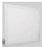
FIGURA 01: Imagem ilustrativa