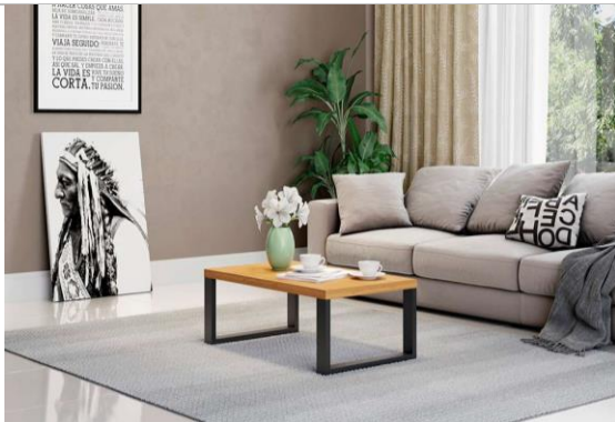
FIGURA 01: Mesa no centro de ambiente residencial