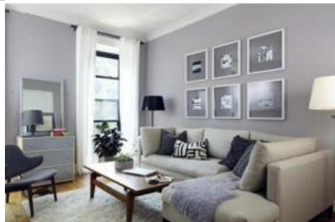
FIGURA 01: . Imagem ilustrativa de cor aplicada em parede residencial