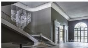
FIGURA 01: Palácio Tangara , zona Sul São Paulo