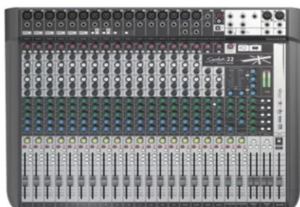
FIGURA 01: - Mesa de som vista de cima