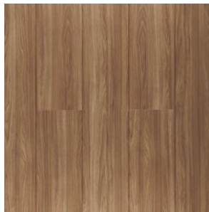
FIGURA 01: . Imagem ilustrativa de veios da peça laminada