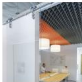
FIGURA 01: Imagem ilustrativa