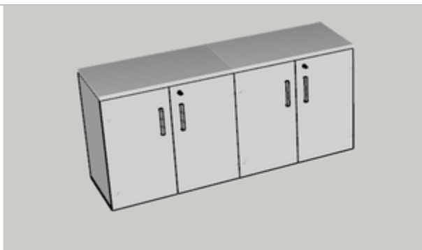
FIGURA 01: Imagem ilustrativa de tipo de armário – desconsiderar cor