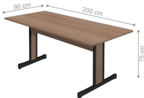
FIGURA 01: Mesa de reunião