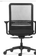
FIGURA 01: Imagem ilustrativa Cadeira Uni all back - Imagem ilustrativa