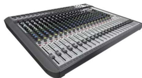
FIGURA 02: Mesa de som vista diagonal