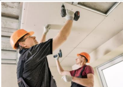
FIGURA 01: Imagem ilustrativa de aplicação de forro de gesso acartonado