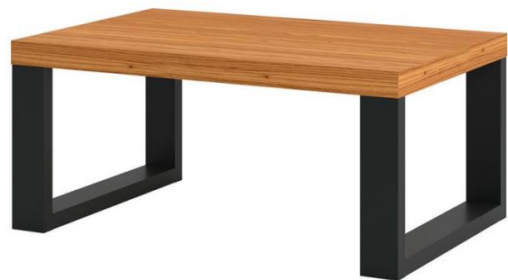
FIGURA 02: Mesa de centro.