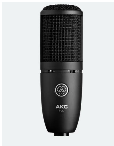
FIGURA 01: Imagem ilustrativa de tipo de microfone